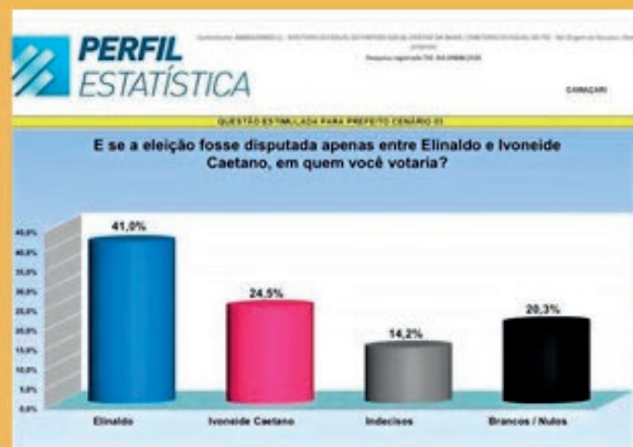
Gráfico adulterado (esq.) e o original ( https://www.instagram.com/perfilestatistica/?hl=pt-br )