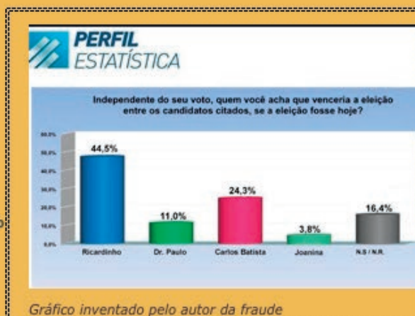
Gráfico inventado pelo autor da fraude